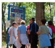
Découverte des Pruneaux

À retourner avec votre chèque , libellé à SAS FERME ET MUSEE DU PRUNEAU « LE GABACH » 47320 LAFITTE SUR LOT Aucune inscription ne sera prise en compte sans le règlement.